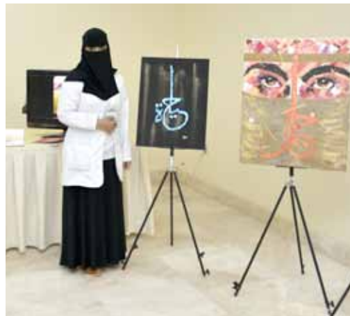
A participant with her masterpieces