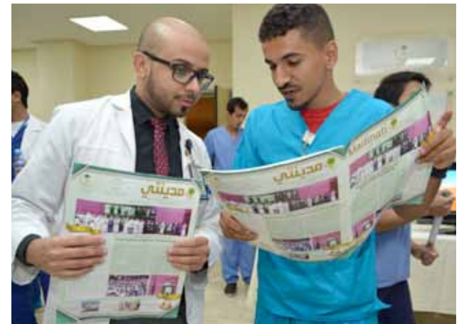
The event was a success with the attendance of employees