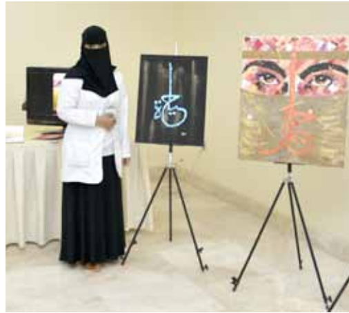
إحدى المشاركات تعرض لوحاتها الفنية